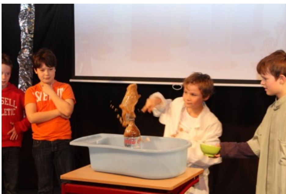
Een zeer geslaagde colafontein-proef tijdens de weeksluiting van bb2. We denken dat Professor Knalgas erg jaloers is....Oefenen professor!

Reacties en opmerkingen welkom op: ronde@montessorischool.nl