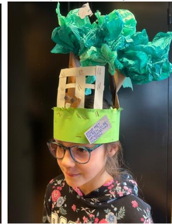
Stop met dieren in gevangenschap houden!