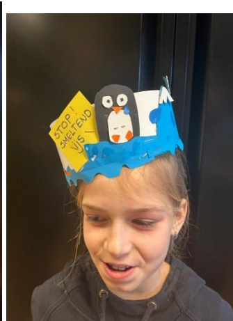
Stop smeltend ijs!