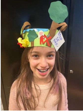
Stop de kap!