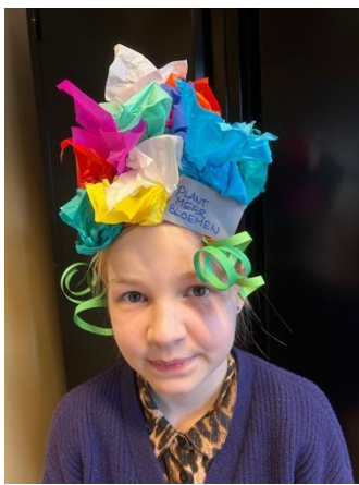
Plant meer bloemen!