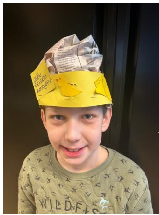
Geen eenden aanrijden!